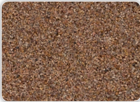
Körnung ca. 0,5 – 1,0 mm

Granitsplitt findet in hochbelasteten Bereichen Anwendung, da er hochabriebfest, sehr gut thermisch belastbar und aufgrund seiner Form (Splitt) besonders gut zum Aufbau hoher Rutschfestigkeiten geeignet ist. Haupteinsatzgebiete: Außenbereiche, Tiefgaragen, speziell die Auf- bzw. Abfahrt, sämtliche Bereiche in denen Gewerke mit hohen Lasten, Nässe, Ölen oder Temperatureinwirkung arbeiten (Schlossereien, Metzgereien, Schlachthäuser).