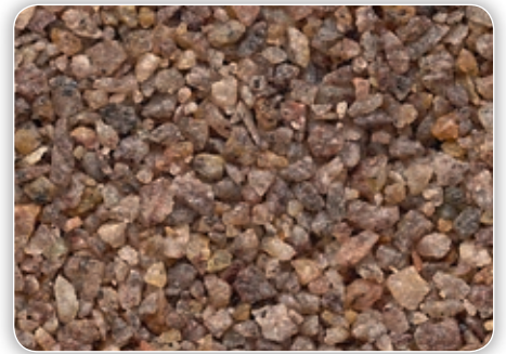
Körnung ca. 1,0 – 3,0 mm