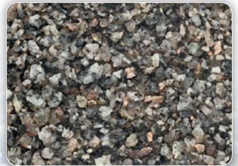
Körnung ca. 1,0 – 3,0 mm