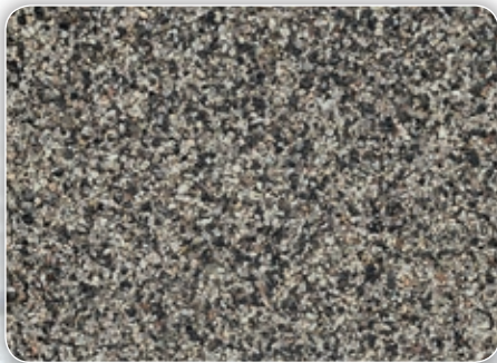
Körnung ca. 0,5 – 1,0 mm