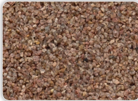
Körnung ca. 1,0 – 2,0 mm