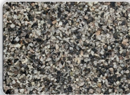
Körnung ca. 1,0 – 2,0 mm